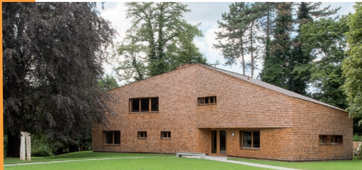
Das Lärchenhaus neben dem HOSPIZ IM PARK Stollenrain 12, 4144 Arlesheim, Telefon 061 706 92 22, info@hospizimpark.ch Öffentliches Verkehrsmittel: Tram Nr. 10. Wenige Parkplätze vorhanden.