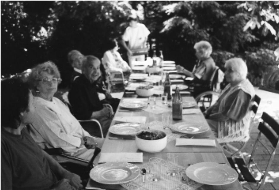
Grill-Party unter den Kastanien...