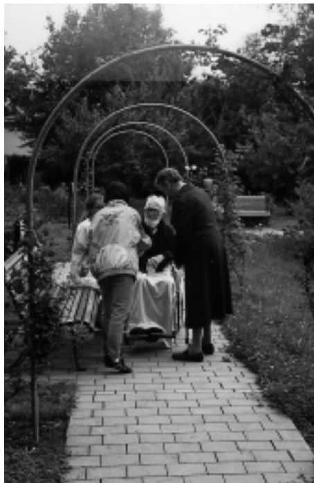
und Begegnung unterwegs...